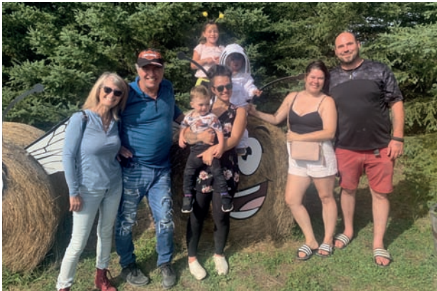
Des visiteurs prennent une photo dans le coin photo qui avait été mis en place lors de la journée « Portes ouvertes Mangeons local » à la Miellerie de la Grande Ourse.

régionale afin de regrouper les articles qui traitent d'agriculture régionale au même endroit.