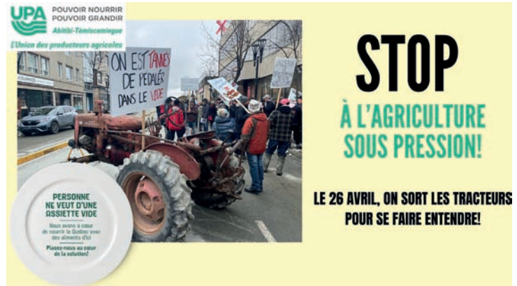
Un des outils de communication conçu et utilisé pendant l'année 2023-2024.