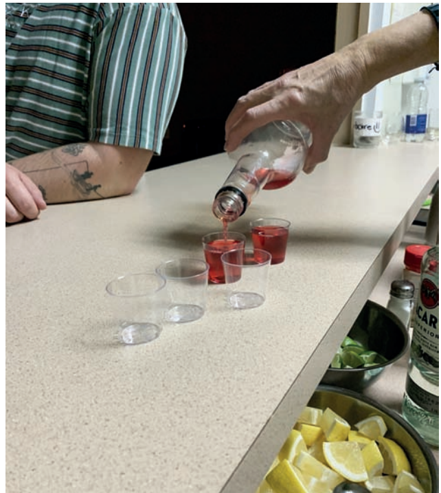
Les shooters ont été très populaires lors de l'édition 2024 de l'activité « Vins et fromages » du Syndicat local de l'UPA du Témiscamingue.