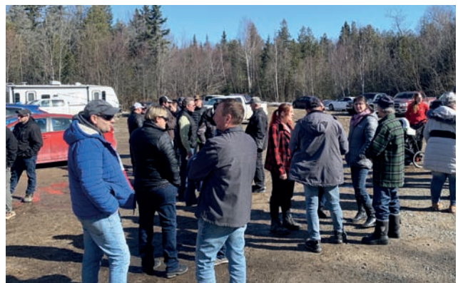
C'est par une belle journée de printemps que de nombreux producteurs et productrices, ainsi que des travailleurs étrangers temporaires, ont participé à l'activité de cabane à sucre à l'Érablière Tem-Sucre.