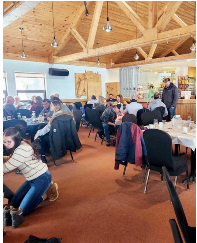
Plusieurs producteurs et productrices, ainsi que leur famille, ont participé à l'activité sociale de cabane à sucre au Club de golf Beattie de La Sarre.