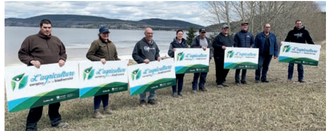
Des entreprises de l'Abitibi et du Témiscamingue ont été reconnues comme « Entreprises complices de la biodiversité ».