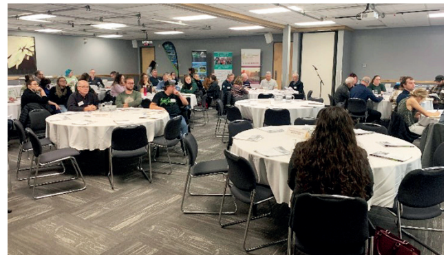
L'AGA de la fédération régionale a eu lieu en octobre 2023, au Centre des congrès de Rouyn-Noranda.