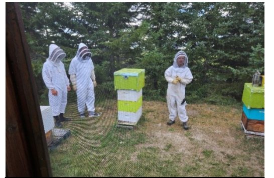
Safari apicole à la Miellerie de la Grande Ourse, à Saint-Marc-de-

Figury. Ils ont notamment pu participer au safari apicole. Le safari a été suivi d'un souper à La Buvette, le restaurant annexé à la Miellerie.