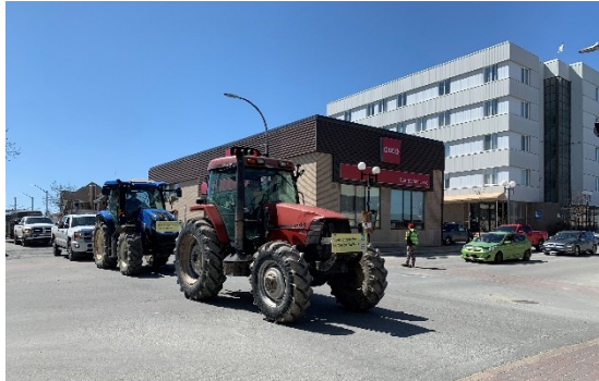
Le début du convoi sur l'avenue Principale, à Rouyn-Noranda.

Les principales revendications sont de faire de l'agriculture une priorité du gouvernement, ce que nous ne ressentons pas depuis plusieurs