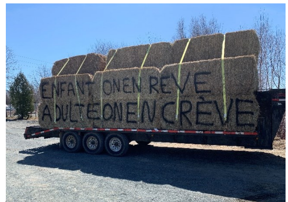
Les messages étaient clairs.

content par la présence d'autant de producteurs et productrices de la région lors de la mobilisation, mais en même temps, il a exprimé sa déception de devoir en arriver là pour se faire entendre. « Si le gouvernement pense que c'est une minorité de producteurs qui est impactée par la situation actuelle, c'est vraiment faux », a-t-il dit.